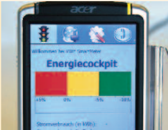
Waschen, wenn die Sonne scheint: Intelligente IKT-Gateways sind die Wegbereiter von einer verbrauchsorientierten Versorgung hin zu einem erzeugungsorientierten Verbrauch.

werden. Insbesondere bei großen Kühlhäusern und Schwimmbädern kann man den Zeitpunkt des Stromverbrauchs besonders flexibel wählen. Das Paradebeispiel werden jedoch die Elektrofahrzeuge sein. Bei ihnen ist es gleichgültig, wann die Batterie geladen wird. Wichtig ist nur, dass sie dann geladen ist, wenn das Fahrzeug das nächste Mal genutzt werden soll.