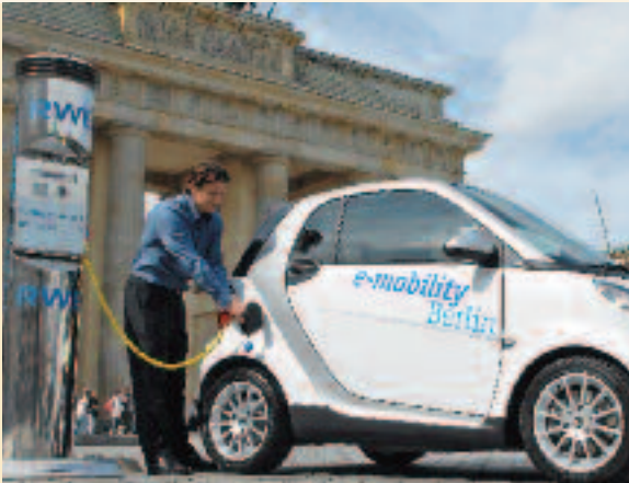
Tanken, wenn der Wind weht: Mit den IKT-Lösungen von E-Energy kann die Batterie des Elektrofahrzeugs dann geladen werden, wenn es günstigen Strom aus erneuerbaren Energien gibt.

Wenn IKT- und Energiewirtschaft erfolgreich zusammenarbeiten und branchenübergreifend Produkte, Verfahren und Dienstleistungen entwickeln, können die Weichen für das Energienetz der Zukunft gestellt werden. Es gilt, Endgeräte mit der nötigen Intelligenz für die Einbindung in das Internet der Energie auszustatten. Neue Speichertechnologien werden vorangetrieben, wobei auch kleine, dezentrale Speicher eine Chance erhalten, in das Netz integriert zu werden. Dezentrale Erzeugungsanlagen gilt es so auszustatten, dass sie nicht nur Strom erzeugen, sondern auch Systemdienstleistungen erbringen. Und nicht zuletzt wird E-Energy die notwendigen Technologien für die Systemintegration der Elektromobilität schaffen. In dem Maße, in dem durch E-Energy die positiven Effekte der Netzintegration von Elektrofahrzeugen genutzt werden können, wird diese Technologie weitere Innovationsanreize erhalten.