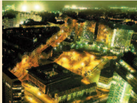
Smart Watts setzt in Aachen das Konzept der intelligenten Kilowattstunde um

Das volle Potenzial der „intelligenten Kilowattstunde“ und der erhöhten Selbstregelfähigkeit des Energiesystems erschließt sich erst durch einen liquiden Markt,