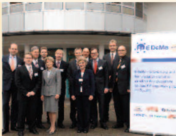
Das Projektkonsortium von E-DeMa bei der Auftaktveranstaltung im November 2008 in Mülheim an der Ruhr

E-DeMa setzt sein Modellvorhaben in der Stadt Mülheim um. In Mülheim werden neben E-DeMa auch Smart Meter und Lösungen aus dem Umfeld E-Mobility realisiert. Die Modellregion liegt im bevölkerungsreichsten Teil Deutschlands und repräsentiert alle Bevölkerungsschichten. Wesentlich am Projekt E-DeMa ist dabei die allgemeine Anwendbarkeit der Lösungen, d. h. es werden für alle Haushalte verallgemeinerbare Lösungen angestrebt.