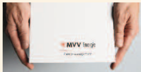
Der Energiebutler® im Projekt Modellstadt Mannheim erlaubt individuelles Energiemanagement, Realisierung dynamischer Tarife und Demand-Response-Mechanismen, um z. B. Kühlgeräte dann abzuschalten, wenn der Strom teuer oder nicht aus regenerativen Quellen erhältlich ist.

E-Energy wird nicht nur zu neuen Dienstleistungen, sondern auch zu einer Vielzahl von neuen technischen Produkten führen, die es auch zu installieren und zu warten gilt. Viele kleine und mittlere Unternehmen – nicht zuletzt das Elektrohandwerk – werden davon ebenso profitieren wie Ingenieurfirmen, Hard- und Softwareproduzenten und die am Weltmarkt operierenden Unternehmen des Energieanlagenbaus.