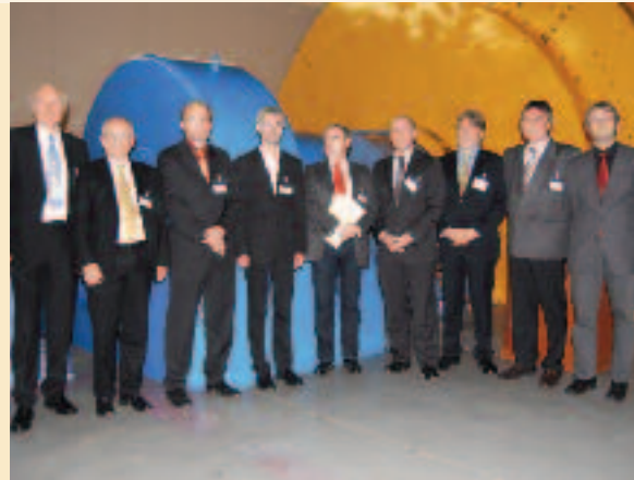
Die Konsortialpartner der Regenerativen Modellregion Harz bei der Auftaktveranstaltung im Dezember 2008 im Pumpspeicherwerk Wendefurth.

Die Elektromobilität zur Netzintegration spielt eine nicht unwichtige Rolle im Projekt. So ist geplant, mehrere Fahrzeuge umzurüsten und zu betreiben. Dazu werden sie mit einer bidirektionalen Schnittstelle versehen und können Energie auch wieder in das Energienetz einspeisen. Neben der Funktion der Fahrzeuge als Speicher sollen auch die Möglichkeiten des Lastmanagements untersucht werden, d. h. das