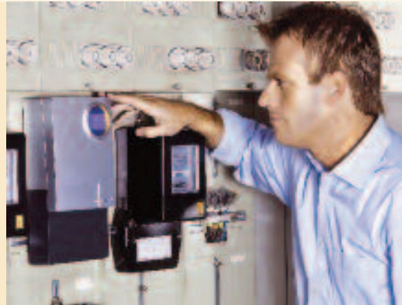
Mit intelligenten Stromzählern lassen sich in Deutschland jährlich 9,5 Milliarden kWh Strom sparen

Ein wichtiger Bestandteil dieses Projekts ist die Entwicklung eines Zertifikats für „Minimum Emission Regions“ und die anschließende Zertifizierung, die wir in der Modellregion beispielhaft durchführen möchten. Zusätzlich erstellt unser Projektkonsortium einen Maßnahmenkatalog und berät Regionen dabei, wie sie ihre Energieeffizienz verbessern können. In Simulationen sollen darüber hinaus unterschiedliche Konzepte und Strategien genauer betrachtet und analysiert werden.